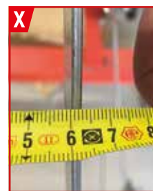
HENI-Produkt ca. 10 mm Asia-Produkt ca. 3 mm