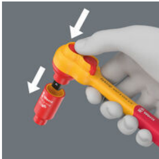
Die Kugelarretierung sorgt für sicheren Sitz der Nüsse und des Zubehörs und damit auch für verlässliche Sicherheit während des Verschraubens.