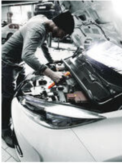
Zyklop Knarre und Zubehör für Elektriker