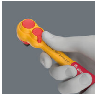
Dank des Umschalthebels ist der Richtungswechsel schnell und bequem möglich.