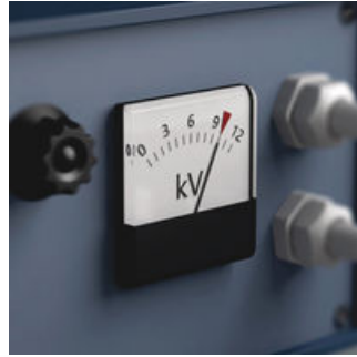
Die Stückprüfung der Zyklop Werkzeuge für Elektriker bei 10.000 Volt gemäß IEC 60900 garantiert sicheres Arbeiten unter Spannung bis 1.000 Volt.