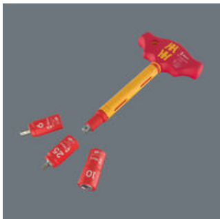
Der VDE-isolierte Quergriff-Adapterschraubendreher 410 i VDE A RA darf nur mit den 1/4" VDE-Bitnüssen und -Steckschlüsseinsätzen der Wera Zyklop VDE Serie 8740, 8760, 8767 und 8790 eingesetzt werden.