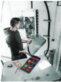
Das Griff/Wechselklingen-System - Kraftform Kompakt VDE