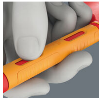
Die Aussparungen in der Freilaufhülse erlauben es, durch Fingerkraft einen Widerstand zu erzeugen. Dies ermöglicht es, die Ratschenmechanik auch bei geringem Schraubwiderstand zu nutzen.