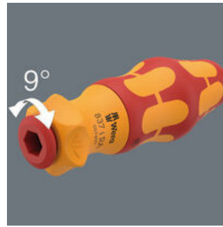
Die integrierte Ratsche mit Feinverzahnung (40 Zähne und ein Rückholwinkel von 9°) vereinfacht und beschleunigt das Schrauben ohne mühsames Neuansetzen.