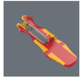
Der Handhalter ist ausschließlich für Wera VDE-Wechselklingen geeignet. Kraftform Plus Griff für angenehm ergonomisches Arbeiten, bei dem Blasen und Schwielen vermieden werden. Harte Griffzonen für hohe Arbeitsgeschwindigkeit, während weiche Griffzonen hohe Drehmomentübertragung garantieren.