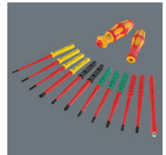
Die 157 mm langen Wechselklingen sind passend für Wera Kraftform Kompakt Griffe mit 9 mm Innensechskant-Aufnahme.