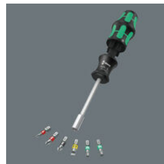
Das Griff/Wechselklingen-System lässt blitzschnellen Austausch der benötigten Klinge und damit vielfältige Anwendungen zu.