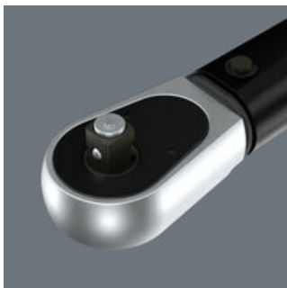
Mit 1/2" Außenvierkant-Abtrieb (inklusive patentierter Nussverriegelung).