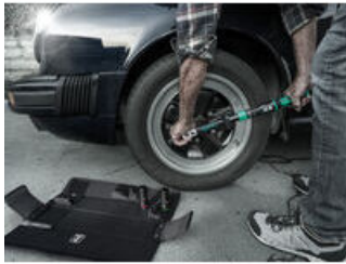
Werkzeug-Set für den Radwechsel