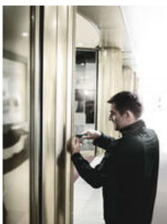
Bits mit reduziertem Schaftdurchmesser