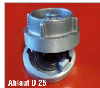
Ablauf D 25