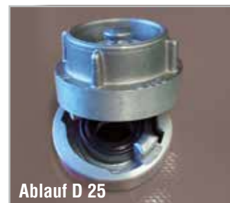
Ablauf D 25